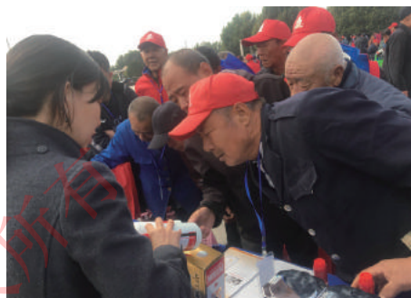
居民向专家了解酒类辨假知识。

测台、举报投诉台，向消费者宣讲产品质量、计量、特种设备方面的相关法律法规，并免费检测家庭用血压计、人体秤，受理举报投诉，他们还走进海滨小学，教学生们如何看懂产品标识、如何识别“三无”食品等基本常识。