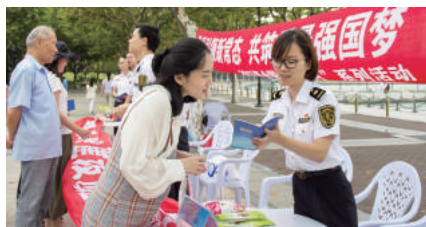
上海检验检疫局工作人员热情解答消费疑难。