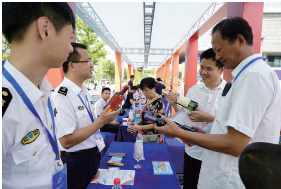
宁波检验检疫局工作人员向消费者介绍酒类产品消费知识。

“一些产品会虚标配置，买的时候要仔细查看。”国家电子计算机质检中心的专家提醒前来咨询的学生们。