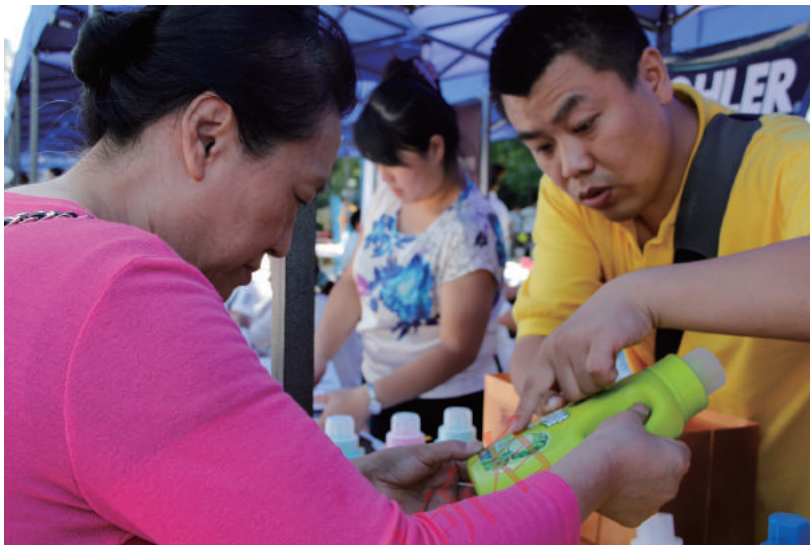
“请您认准这个标志，买我们的产品。”参加活动的企业代表告诉消费者。

在消费品质量安全“三进”活动中，各地质检部门还广泛组织开展了消费品质量安全监管研讨活动。围绕“社区、乡镇消费者如何参与消费品质量安