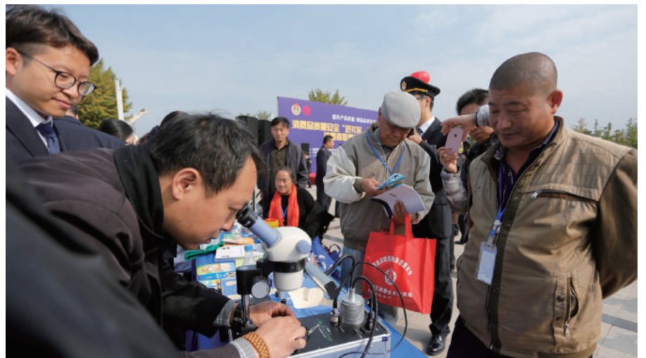
质检专家为消费者检测珠宝产品。