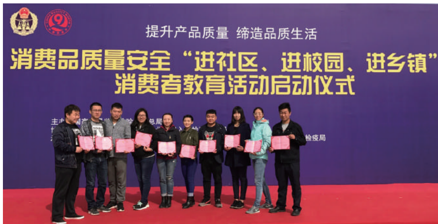
手捧消费品质量安全风险信息监测员聘书的居民高兴地合影留念。