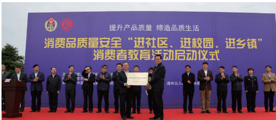
质检总局总检验师张际文向永乐店镇颁发“消费品质量安全风险信息监测点”牌匾。量安全风险信息推送给社区；

江苏省共在全省设立87个监测点，在社区政务中心开展消费品满意度调查、消费品使用体验调查等，收集消费品质量安全风险信息，并将在消费品及工业产品质量监督管理过程中发现的质