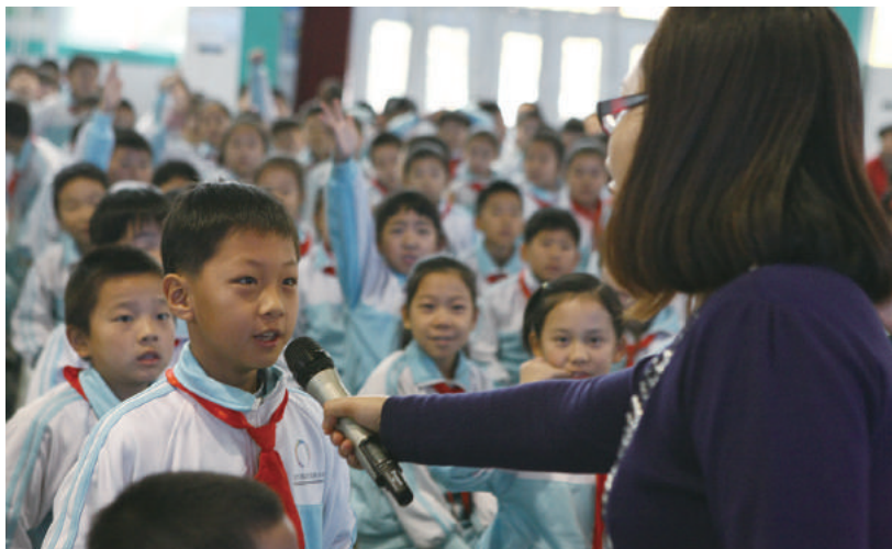
海淀民族小学学生抢答消费品质量安全知识问题。