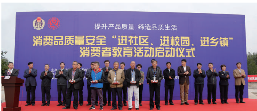
5位永乐店镇村民代表各自所在村委会领取消费品质量安全知识系列宣传手册。

2016年，湖南省质监局组织质检、纤检、计量、特设等技术机构的专业技术人员组成志愿者服务队，深入乡镇为居民发放消费品质量安全知识手册，围绕家用电器、建材、食品相关产品、电子产品、纺织服装、质量鉴定6个主题开展现场咨询等惠民服务。上海市质监局在“三进”基础上拓展活动范围，开展了消费品质量安全“五进”活动——进厂区、进园区、进商区、进社区、进校区。在进厂区活动中，他们组织技术机构走进消费品生产企业，通过标准宣贯、技术培训、质量分析提升、计量能力提升、产品检测等，帮助企业解决生产中遇到的质量问题；在进社区活动中，他们组织开展了多场消费品质量体验周活动，组织有代表性的消费品生产企业直接面向消费者开展消费品质量体验活动，宣讲产品选购常识。