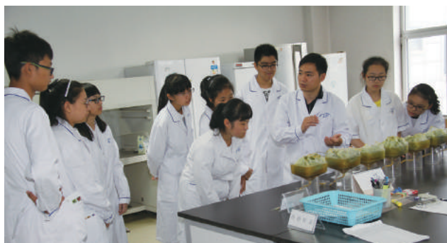
天津检验检疫局工作人员向中学生讲解动植物与食品检测知识。

江苏检验检疫局针对质量安全风险较大的消费品，以及自我保护能力较弱的老人、儿童等人群，以进口电器、进口日用品、进口玩具等产品为重点，向消费者介绍进口产品监管体系