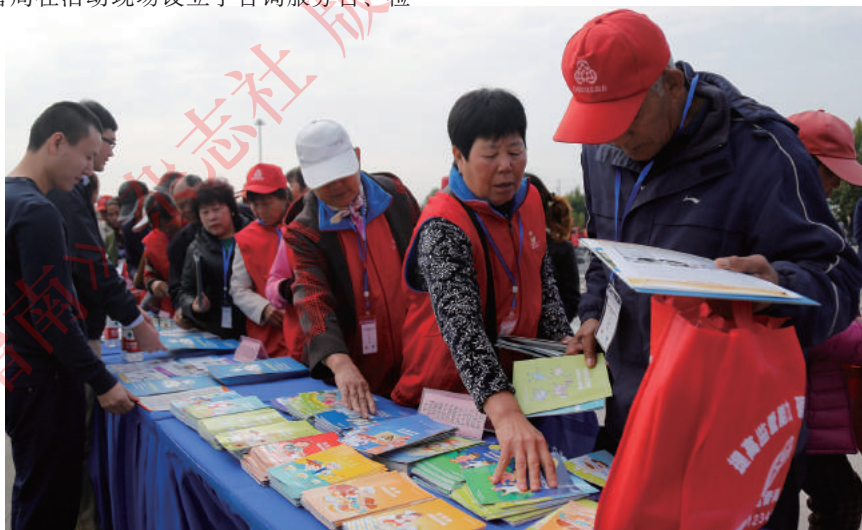
永乐店镇居民领取消费品质量安全知识手册。