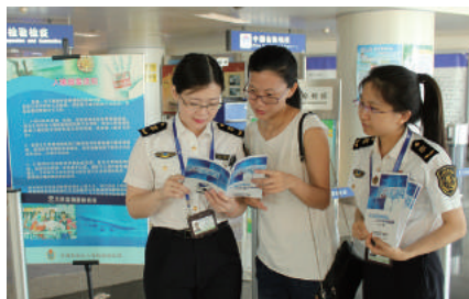
天津检验检疫局工作人员在机场进行消费品质量安全知识和出入境特殊物品政策宣传。

“您家的热水器早就过了使用期限，继续使用有危险隐患。”“电热水器要有单独开关的插座，还要定期检查