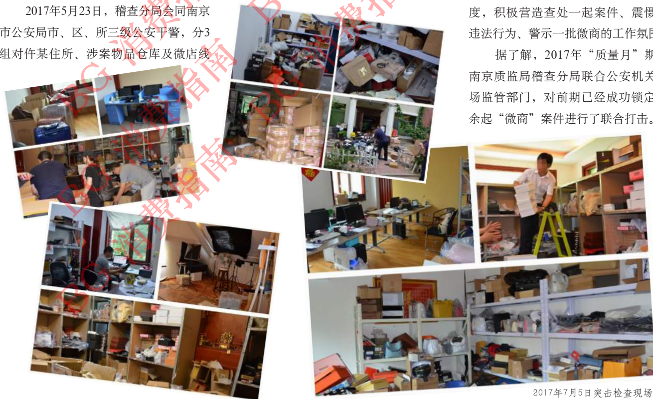
2017年7月5日突击检查现场

据了解，2017年“质量月”期间，南京质监局稽查分局联合公安机关和市场监管部门，对前期已经成功锁定的20余起“微商”案件进行了联合打击。●