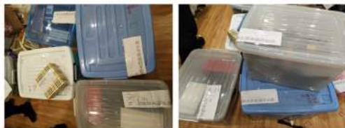
微店18.shop案，稽查分局扣押物资